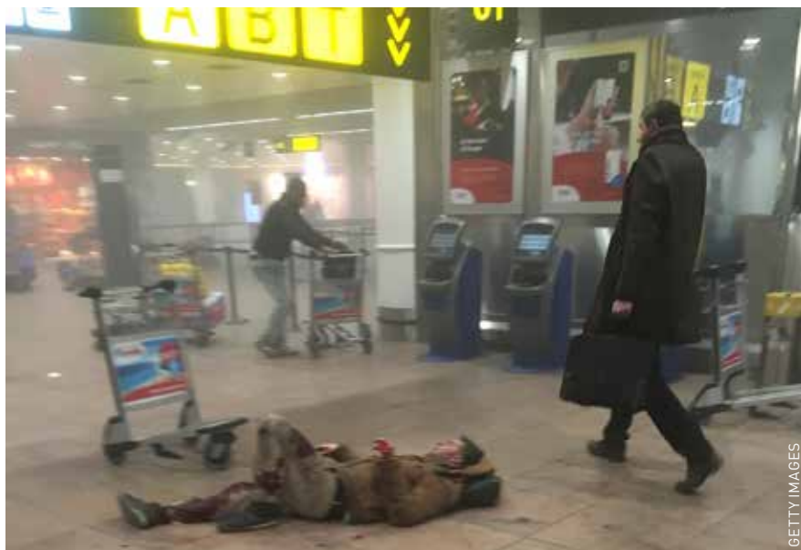
Na de aanslag op vliegveld Zaventem, 22 maart jl.