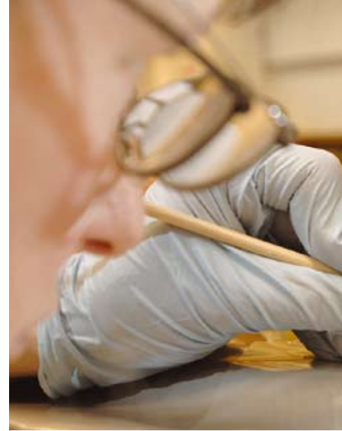
Bij het restauratieproces is uitgegaan van de hedendaagse ingrepen omkeerbaar moeten zijn.

<< zomer de bewaartemperatuur laag te houden. Gevolg daarvan is dat in de loop der jaren bij een deel van de wasmodellen de originele ondersteunende constructies zijn verdwenen of breuklijnen zijn ontstaan.