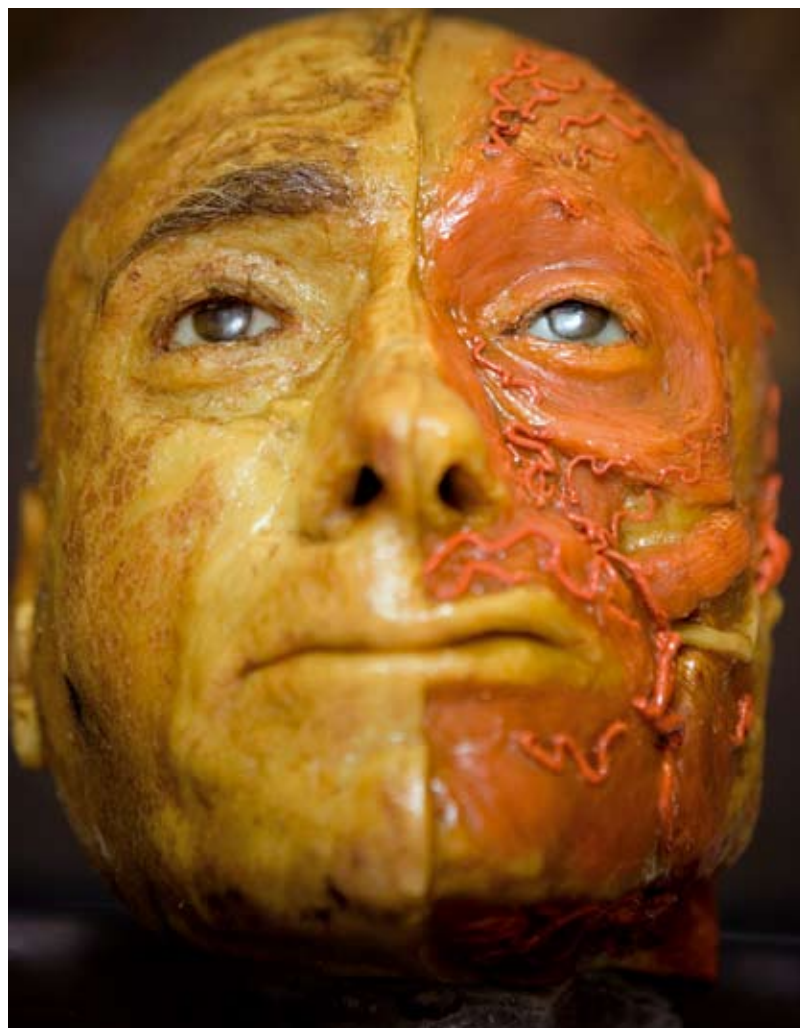
Leken denken nogal eens dat de modellen bestaan uit geprepareerd menselijk weefsel.