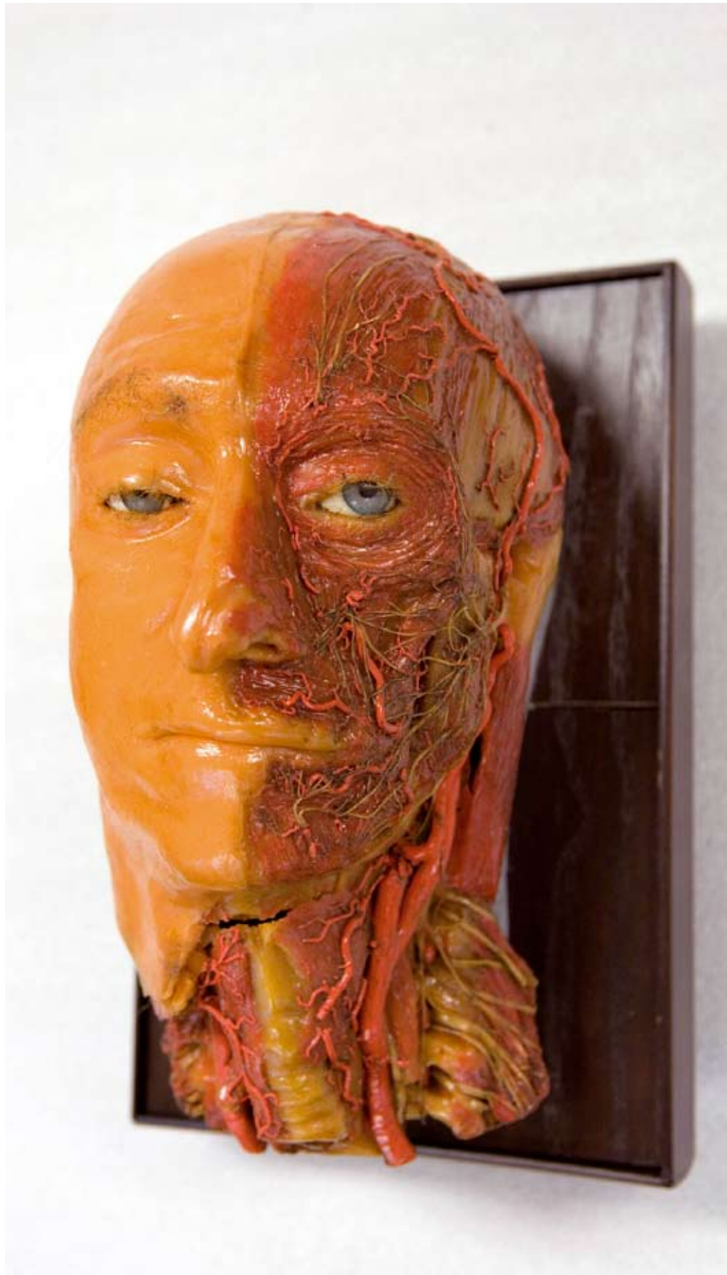
Bij de restauratie zijn niet alle beschadigingen weggewerkt - hier is boven het strottenhoofd nog een breuklijn te zien.

In vroeger tijden was het echter nagenoeg onmogelijk om in de >>