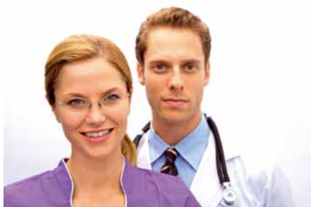
Ruim 90 procent van de waarnemers vindt het opzetten van waarnemersgroepen (wagro's) een goed initiatief.

Waarnemers hebben hart voor hun vak. Ruim een kwart van hen wil naast spreekuur houden en visites lopen graag meer taken op zich nemen. Managementtaken, begeleiding en supervisie staan hoog op het wensenlijstje. Dat waarnemers zich betrokken voelen bij meer dan alleen de patiëntenzorg, blijkt ook uit het feit dat een groot deel van hen zich wil inzetten voor nascholingen en bestuurswerk. Uitbreiding van intercollegiale nascholing en toetsgroepen is een wens en een manier om dit te bereiken is het oprichten van waarnemersgroepen, oftewel wagro's (naar analogie van hagro; huisartsengroep). Ruim 90 procent van de waarnemers vindt het opzetten van wagro's dan ook een goed initiatief, met name vanwege de mogelijkheid tot afvaardiging en inspraak