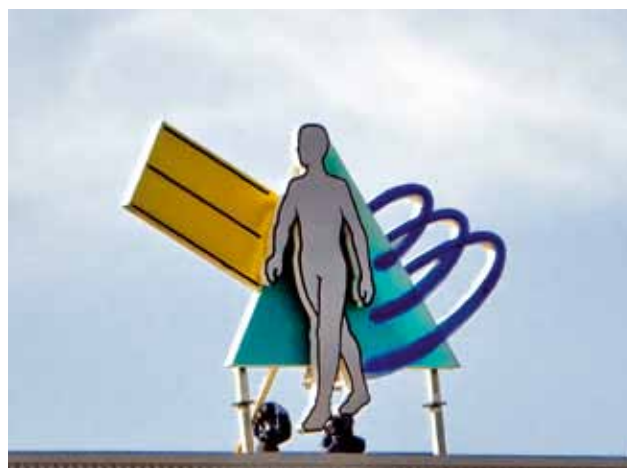
In haar tweede rapport onderzocht de commissie-Lemstra de wijze waarop het Medisch Spectrum Twente (MST) de zaak had afgehandeld nadat de neuroloog was vertrokken.

zich vrijwel meteen gesteld zag tegenover de 'machtige' verzekeraar, die –niet onbegrijpelijk overigens– veelal handelde op basis van het uitgangspunt 'claim afwijzen, tenzij'. De commissie-Lemstra accentueert een verantwoordelijkheid die de laatste tijd in de literatuur steeds vaker wordt genoemd en die ook te vinden is in de in juni 2010 tot stand gekomen, en